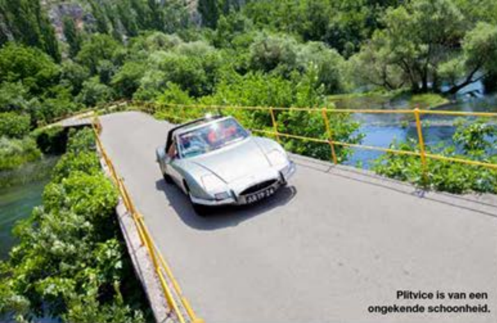
Plitvice is van een ongekende schoonheid.

J e krijgt er gespierde kuit en dikke spierballen van, van Robi's Matra. Het betreft hier namelijk een automobiel uit het jaar 1970.