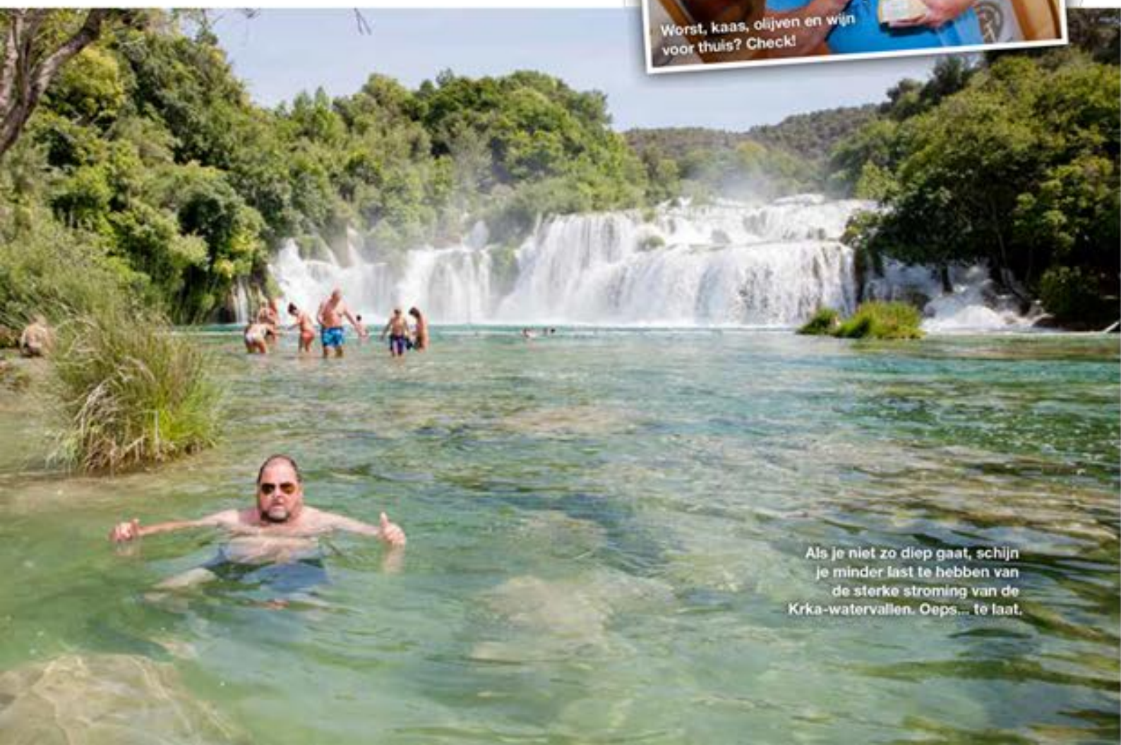
Als je niet zo diep gaat, schijn je minder last te hebben van de sterke stroming van de Krka-watervallen. Oeps... te laat.