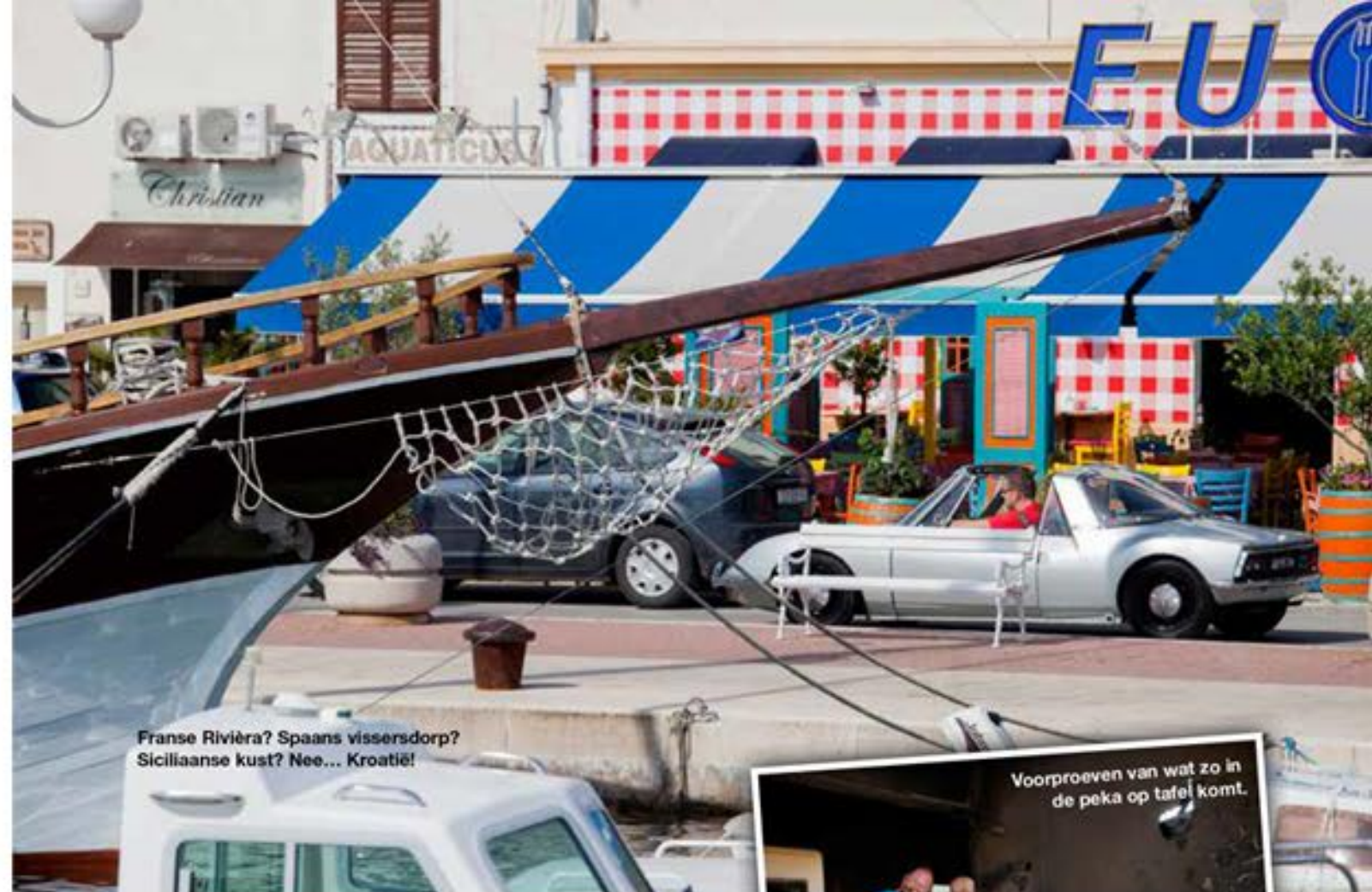
Franse Riviera? Spaans vissersdorp? Siciliaanse kust? Nee... Kroatië!

zen met klassieke (of andere, zie kader) auto's door zijn tweede thuisland, het mediterrane Kroatië. Is dat een mooi land om door te rijden? hoor ik u vragen. Ja, dat is een enorm mooi land om door te rijden zelfs. Ik had voor ik naar Zagreb vloog geen enkel beeld van Kroatië. Ja, kamperen en warm. Plus rotsachtige stranden. Vage verhalen van nog vagere kennissen. Maar al op het moment dat we met het huurautootje Opatija, een stadje aan de Adriatische zee, in rijden, krijg ik een vakantiegevoel. Een oude Franse badplaats, Cannes of zo, daar doet het me aan denken. Ik zie een boulevard waar mensen in zomerjurken en lichte