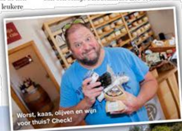
Worst, kaas, olijven en wijn voor thuis? Check!

water naar een iets dieper stuk getrokken heb en ga zwemmen moet ik lang en hard borstcrawlen tegen de woeste stroom in om de pakweg 10 meter naar het stuk waar ik heen wil te overbruggen. Gaaf! Dat is nog eens wat anders dan een stukje Middellandse Zee of een