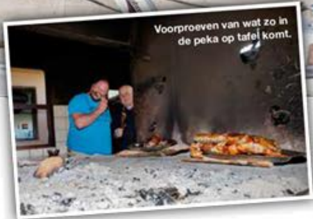
Voorproeven van wat zo in de peka op tafel komt.

broeken flaneren, statige oude of luxeuze nieuwe hotels aan de kust, jachthaventje met dure boten. Opatija is het vertrekpunt van Robi's reizen. Of in ieder geval van de onze. Vanwege de mooie maar ook centrale ligging.