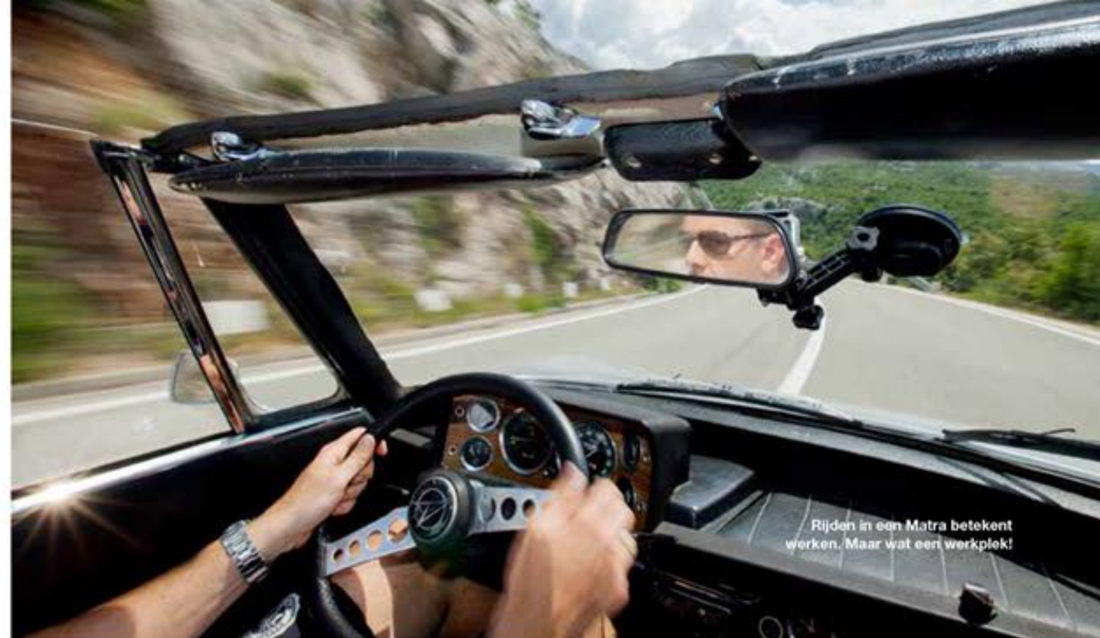
Rijden in een Matra betekent werken. Maar wat een werkplek!

hotelzwebedjke beden ik tevreden maar hijgend op weer een ander rotsblok. Ik zwaai naar de fotograaf.