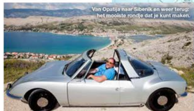
Van Opatija naar Sibeniik en weer terug: het mooiste rondje dat je kunt maken.

zen met klassieke (of andere, zie kader) auto's door zijn tweede thuisland, het mediterrane Kroatië. Is dat een mooi land om door te rijden? hoor ik u vragen. Ja, dat is een enorm mooi land om door te rijden zelfs. Ik had voor ik naar Zagreb vloog geen enkel beeld van Kroatië. Ja, kamperen en warm. Plus rotsachtige stranden. Vage verhalen van nog vagere kennissen. Maar al op het moment dat we met het huurautootje Opatija, een stadje aan de Adriatische zee, in rijden, krijg ik een vakantiegevoel. Een oude Franse badplaats, Cannes of zo, daar doet het me aan denken. Ik zie een boulevard waar mensen in zomerjurken en lichte